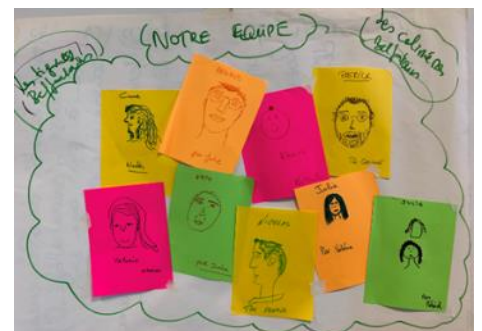
Quand l'équipe se dessine, lors d'une séance de brainstorming autour de l'identité de la marque

ChickyPop, c'est aussi plein de belles rencontres, et de précieux soutiens extérieurs. Nous pensons notamment à :